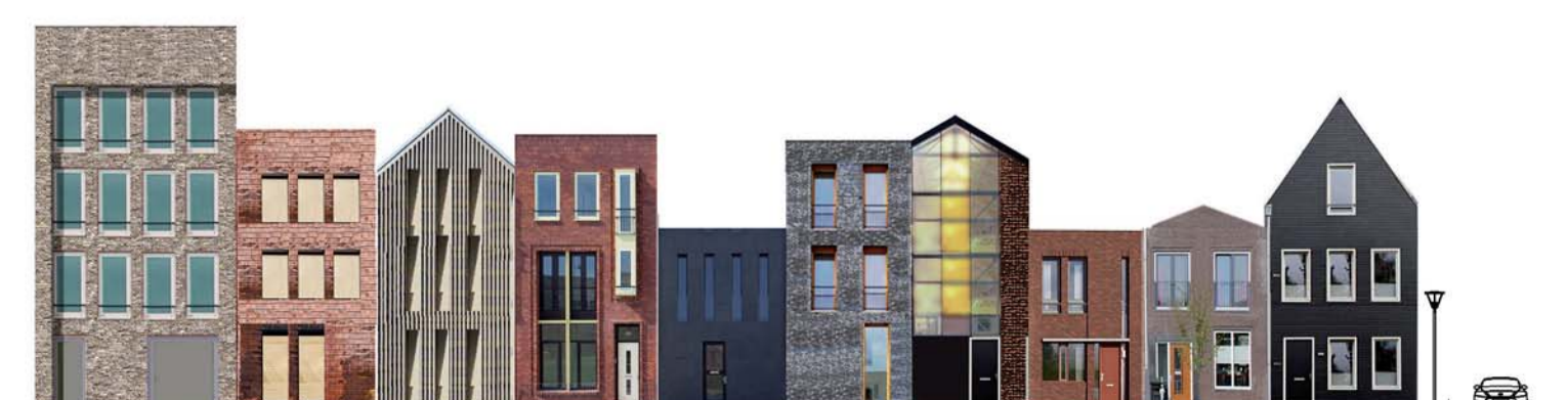
VOORBEELD STRAATBEELD OUDE HAAGWEG